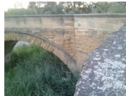
Le repère est au centre de la photo