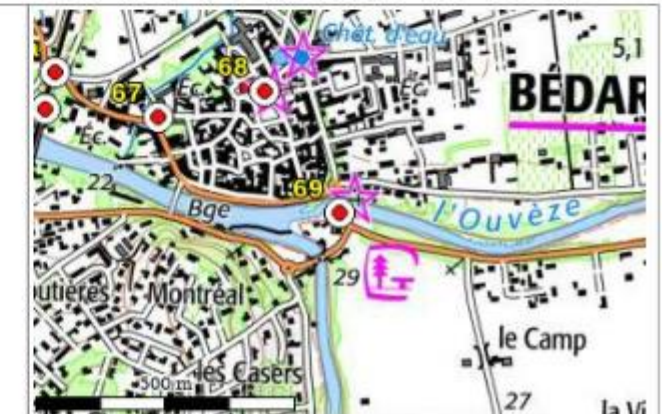
Carte : 3041 AVIGNON